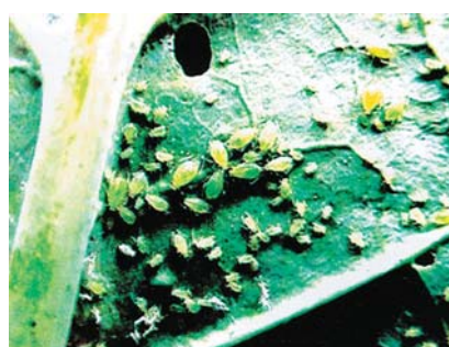
चित्र ११ : लाही कीरा