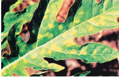
(ग) पातको माथिल्लो सतहमा