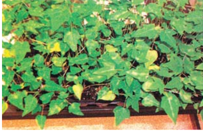
(क) साना विरूवामा