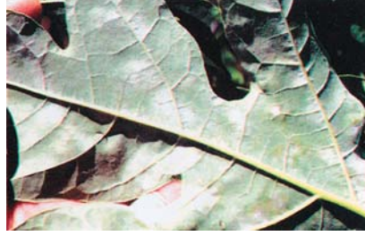
(ख) पातको तल्लो सतहमा