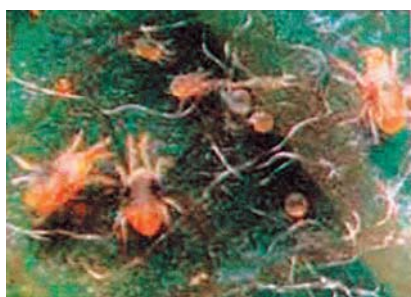
चित्र ८ : रातो सुलसुले