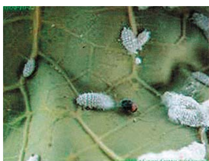
चित्र १० : मिलिबग